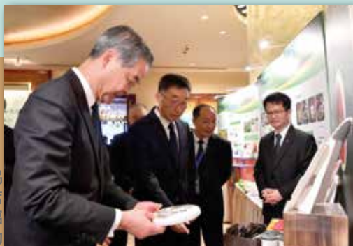
全國政協 副主席 梁振英蒞臨 是次活動