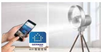
智能家居電器系列