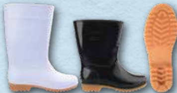
日本ZONA G5 勞工水靴 ZONA G5 Labor Boots 偉豐鞋業有限公司 Well Fong Footwear Company Limited