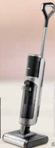
無線乾濕拖地吸塵機