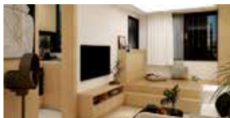
全屋電器傢俬配套