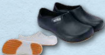
艾樂跑新一代超防滑舒適廚師鞋 ARRIBA New Style Chef Shoes 偉豐鞋業有限公司 Well Fong Footwear Company Limited