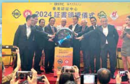
2024 證書頒授儀式 暨 產品安全嘉年華