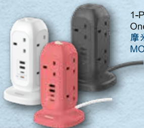
1-Plug PD20W 2A2C 7位拖板 OnePlug 7-Outlet Power Strip With USB 摩米士科技 (香港) 有限公司 MOMAX Technology (Hong Kong) Limited