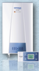
纖巧系列即熱式電熱水器 Compact series instant electric water heater (3 phase) 德國寶 (香港) 有限公司 German Pool (Hong Kong) Limited