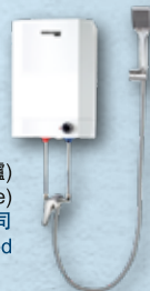
速熱式電熱水器 (花灑型電熱水爐) Rapid electric water heater (shower type) 德國寶 (香港) 有限公司 German Pool (Hong Kong) Limited