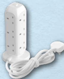
ONEPLUG PD20W 2A2C 11位拖板 OnePlug 11-Outlet Power Strip With USB 摩米士科技 (香港) 有限公司 MOMAX Technology (Hong Kong) Limited