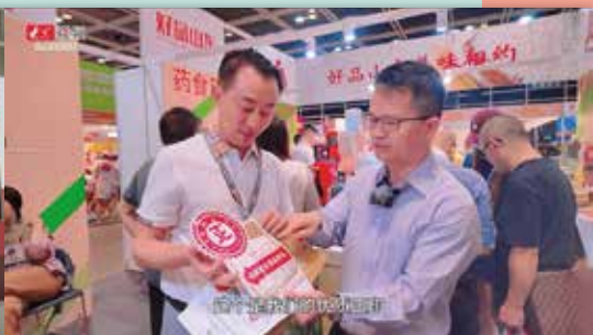
山東展區 - 香港美食博覽2024