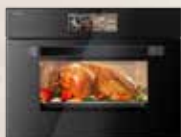
嵌入式微波蒸烤焗爐