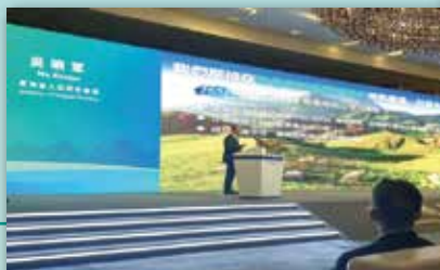
青海香港經貿交流合作推介會 (簽約儀式和產品推廣活動)