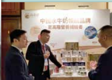
2024廣西企業香港之行 暨 港麗酒店產品推廣活動