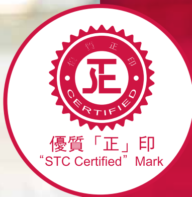
優質「正」印 “STC Certified” Mark

有見及此，香港認證中心 (HKCC) 推出了一個專業而具獨立性的產品品質標誌——「優質『正』印」，為內地、香港、澳門 (包括大灣區)，以及國際市場提供一個對「品質」的清晰定義。