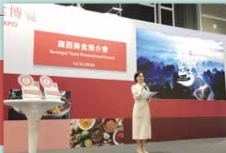
廣西企業產品推介會 - 香港美食博覽2024