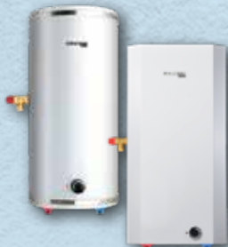
中央式電熱水器 — 儲水式 (掛牆) Central electric water heater — storage type (wall-mounted) 德國寶 (香港) 有限公司 German Pool (Hong Kong) Limited