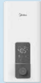
18kW 即熱式熱水爐 (型號：DFS180HK) 18kW Instant Electric Water Heater 美的電器（香港）有限公司 Midea Electric (HK) Limited