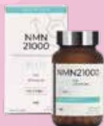
ELXR Lab NMN21000 PLUS 多匯妥有限公司 Trade In Limited

Goji Seed Oil Capsule 美國仁心仁術健康國際（香港）有限公司 USA L&H Health Int'l (HK) Limited