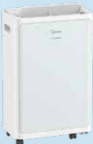
二合一空氣淨化抽濕機 (型號：MDD1-28L3D) 28L 2-in-1 Air Purifying Dehumidifier 美的電器（香港）有限公司 Midea Electric (HK) Limited