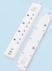
XPower PS4D 7 輸出 2 USB + 1 Type-C 4 頭拖板 XPower PS4D 7 Output 2 USB + 1 Type-C, 4 Sockets Power Strip 皇者國際貿易有限公司 XPOWER INTERNATIONAL TRADING LTD.