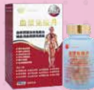
血漿免疫丹 Blood Plasma Immunity Pellet

美國仁心仁術健康國際（香港）有限公司 USA L&H Health Int'l (HK) Limited