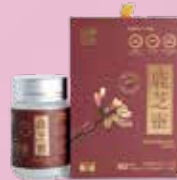
騰泰堂鹿芝靈 Gallop-Ganorhoeps Capsule 騰泰康世貿有限公司 Gallop Worldtrade Limited