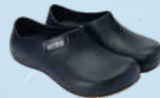
艾樂跑新一代超防滑舒適廚師鞋 ARRIBA New Style Chef Shoes 偉豐鞋業有限公司 Well Fong Footwear Company Limited