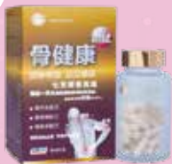
骨健康 Bone Fit

美國仁心仁術健康國際（香港）有限公司 USA L&H Health Int'l (HK) Limited